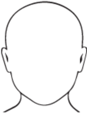
Este soy yo